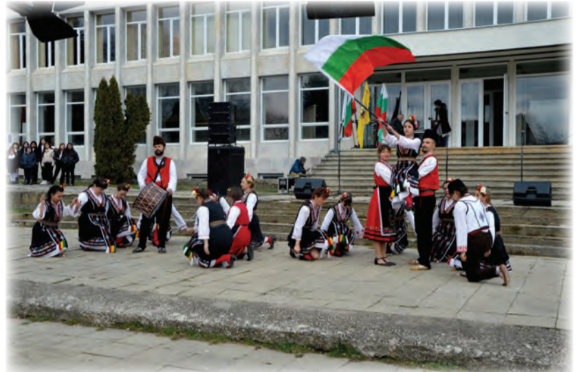
Клуб по български народни танци "Жарава"