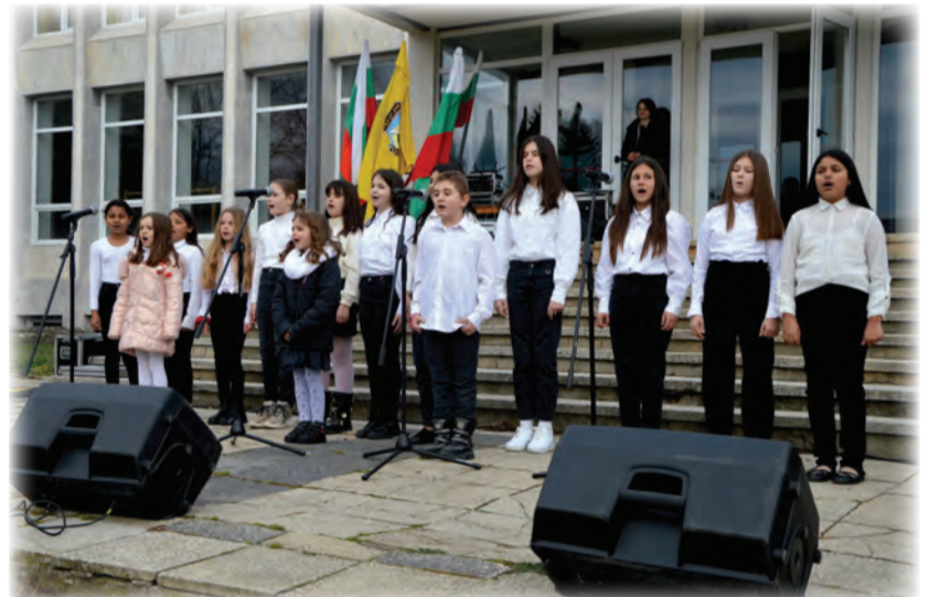
СУ "Васил Левски" - град Вълчи дол