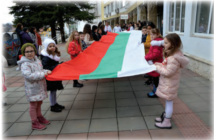
10-метровото национално знаме поведе празничното шествие