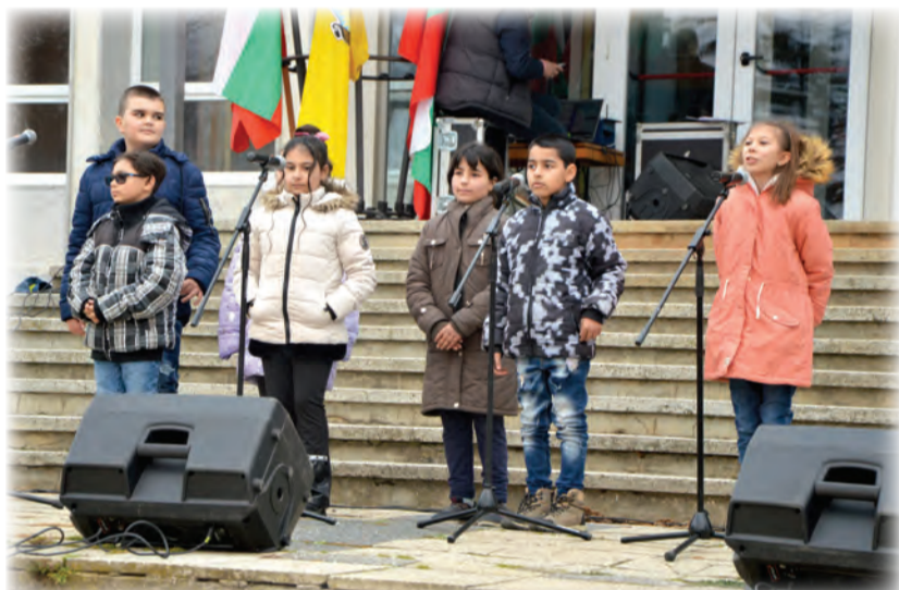
ОУ "Климент Охридски" - село Стефан Караджа