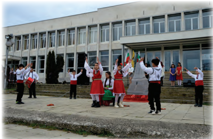
ОбУ "Васил Левски" - село Михалич