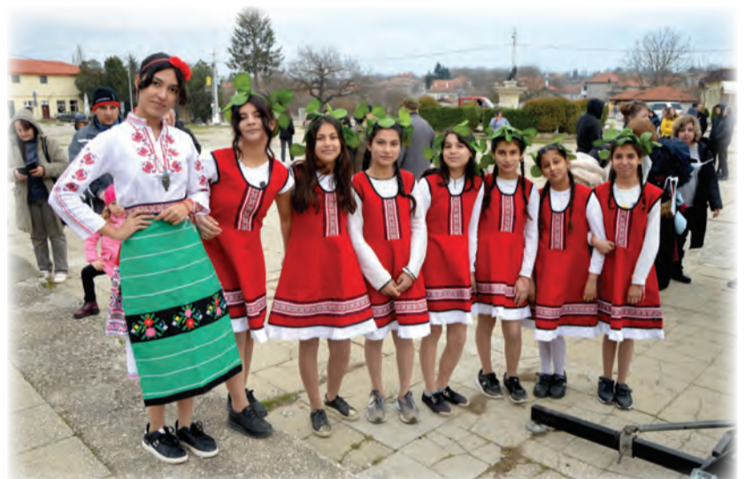
ОбУ "Св. Иван Рилски" - село Червенци