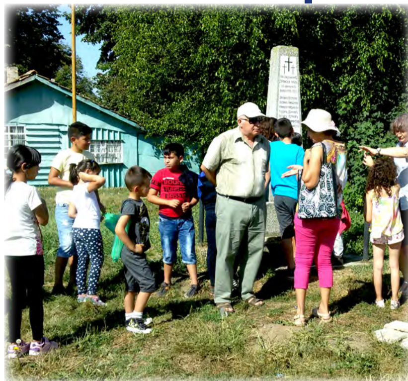
На героите - поклон!

Трудно е нали? Да, трудно ни е на нас, а камо ли на децата! След това се запитайте, дали са там, където искате да бъдат, или трябва да се откажат от поведението, което е разрушително за тях? Помислете внимателно за отговорите... Насърчавайте децата си да приемат, че докато растат, ще имат различни очаквания и предизвикателства, с които ще се справят. Наша е отговорността да им помогнем. Да изградим тяхната увереност и доверие в тях самите и в нас. Постоянно да ги предизвикваме и насърчаваме на най-важното да вярват в себе си, дори когато се провалят. Да им помогаме да си поставят цели, да изградят умения да се фокусират повече върху упоритата си работа, а не само върху действителните резултати. С усилия и последователност можем да изградим увереност в децата, която ще им помогне да устоят дори на най-трудните неуспехи.