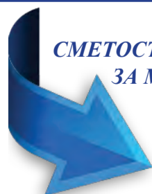
ГРАФИК НА СМЕТОСЪБИРАНЕТО ЗА МЕСЕЦ МАЙ