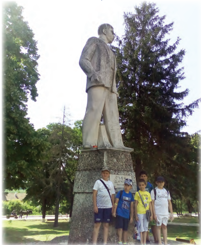
На героите - поклон!