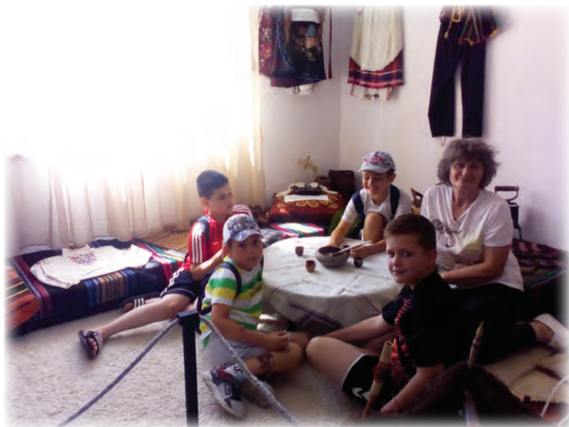
Всичко българско и родно любя, тача и милея...

З дравейте приятели! Ето ни и нас - Местната комисия за борба срещу противобществените прояви на малолетните и непълнолетните, община Вълчи дол. Отново сме с Вас, за да споделим, да Ви чуем, да проявим разбиране, да подкрепим! Кого? То се знае, Вас - родителите и децата! Не искаме да прищорваме децата си да бъдат малки възрастни, нали? Но когато става въпрос за житейски умения, те трябва да бъдат научени рано, така че да се превърнат в добри хора. За това сме до тях, подкрепяме ги и ги разбираме. Насърчаваме ги да бъдат активни, мислещи и можещи.