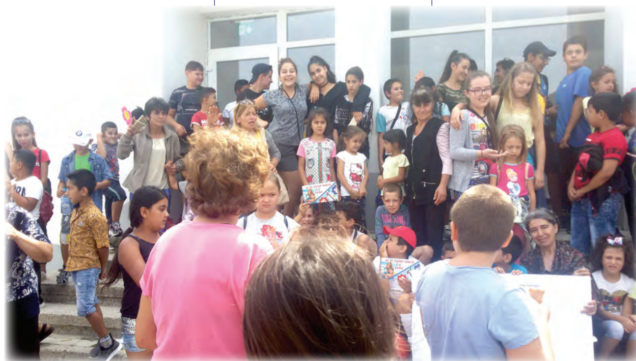
Моят свят в моето населено място