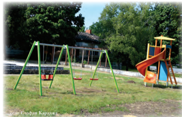
село Стефан Караджа