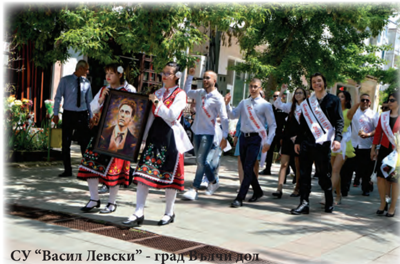
СУ "Васил Левски" - град Вълчи дол