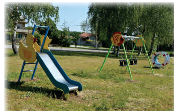
град Вълчи дол