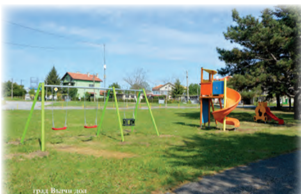
град Вълчи дол