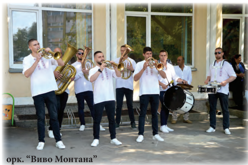
орк. "Виво Монтана"

24 май – Денят на Светите братя Кирил и Методий, на българската просвета и култура и на славянската книжовност бе отбелязан тържествено в град Вълчи дол.