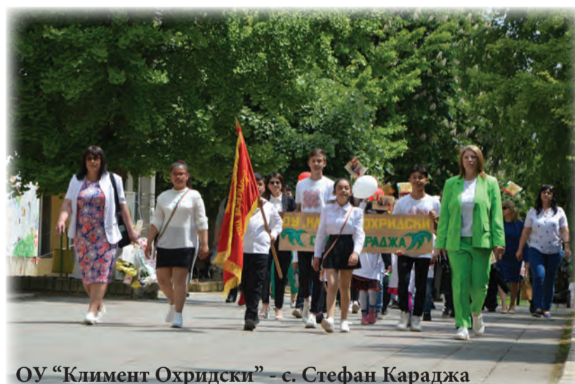
ОУ "Климент Охридски" - с. Стефан Караджа