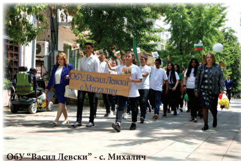
ОБУ "Васил Левски" - с. Михалич