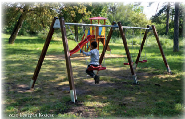
село Генерал Колево

Със средства от утвърдената Инвестиционна програма на Община Вълчи дол за 2022 година, бяха закупени, доставени и монтирани детски съоръжения за игра в два парка в град Вълчи дол, както и в селата Стефан Караджа, Брестак, Добротич и Генерал Колево. Децата от община Вълчи дол ще могат да се насладят на приятна игра през топлите месеци от годината. Монтираните съоръжения са комбинирани детски съоръжения, детски люлки, пързалки, беседка с пейки, детски тунел. Общинска администрация - Вълчи дол пожелава приказно лято на всички деца!