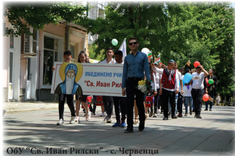
ОБУ "Св. Иван Рилски" - с. Червенци