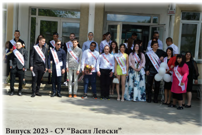
Випуск 2023 - СУ "Васил Левски"

Специални благодарности и към момчетата от оркестър „Виво Монтана“, без които празникът нямаше да бъде същия!