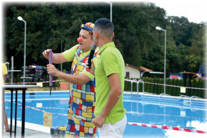
Детското шоу зарадва малчуганите с много изненади.

В три последователни дни, с богата празнична програма, Вълчи дол отбеляза 49-тата годишнина от обявяването си за град.