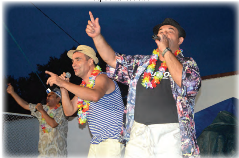
„Тутурутка“ представиха шоуто си „Смях до дупка“.