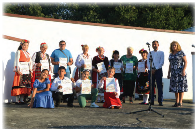
Общинският фолклорен празник потопи зрителите в магията на българското фолклорно изкуство.