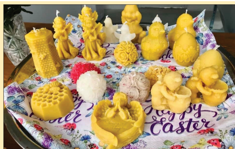
Денят на Св. Харалампий, 10-и февруари, беше отбелязан с базар в подкрепа на местни пчелари, градинари и овощари, организиран от Културен дом - Вълчи дол.

ресурси в областта на рибарството. От друга - ще помогне на общините да добавят рибарството към туристическия продукт, който все по-успешно развиват. Партньорството ще се формира от представители на публичните и частните местни социално-икономически интереси - юридически лица и организации. Местният парламент упълномощи кмета Калоян Цветков да представлява общината в партньорството по проекта и подпише споразумението за партньорство.