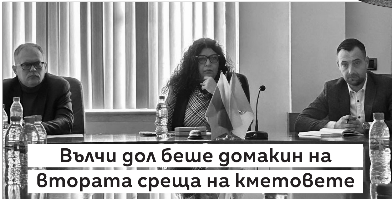
Вълчи дол беше домакин на Втората среща на кметовете

Присъстващите кметове споделиха, че цената за кастриране, чипиране и оебзпаразитяване на бездомните кучета става все по-висока и вече достига 150 лева на животно. Като цяло издръжката на бездомно куче е в пъти