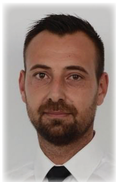
Март 2024 г.

Община Вълчи дол кандидатства с проектно предложение „Закупуване на лекотоварен автомобил за нуждите на