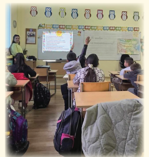
Екипът за подкрепа за личностно развитие на СУ „Васил Левски“, заедно с учениците от трети клас, проведе урок по толерантност във връзка с Международния ден на толерантността - 16 ноември! Третокласниците отговаряха на въпроси и решаваха казуси.