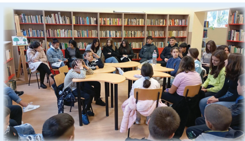
За поредна година учители и ученици от СУ „Васил Левски“, гр. Вълчи дол се включиха в инициативата „Ден на четенето“. Щафетното четене беше най-атрактивното предизвикателство, може би защото имаше състезателен характер.

Спазвайте правилата за пожарна безопасност! Не позволявайте пожар да унищожи имуществото Ви или да бъде причина за смъртта на вашите деца и близки!