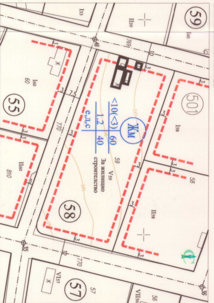
Таблица с градоустройствени показатели за Урегулирани поземлени имоти

Кадастрална координатна система 2005 Височинна система: Балтийска