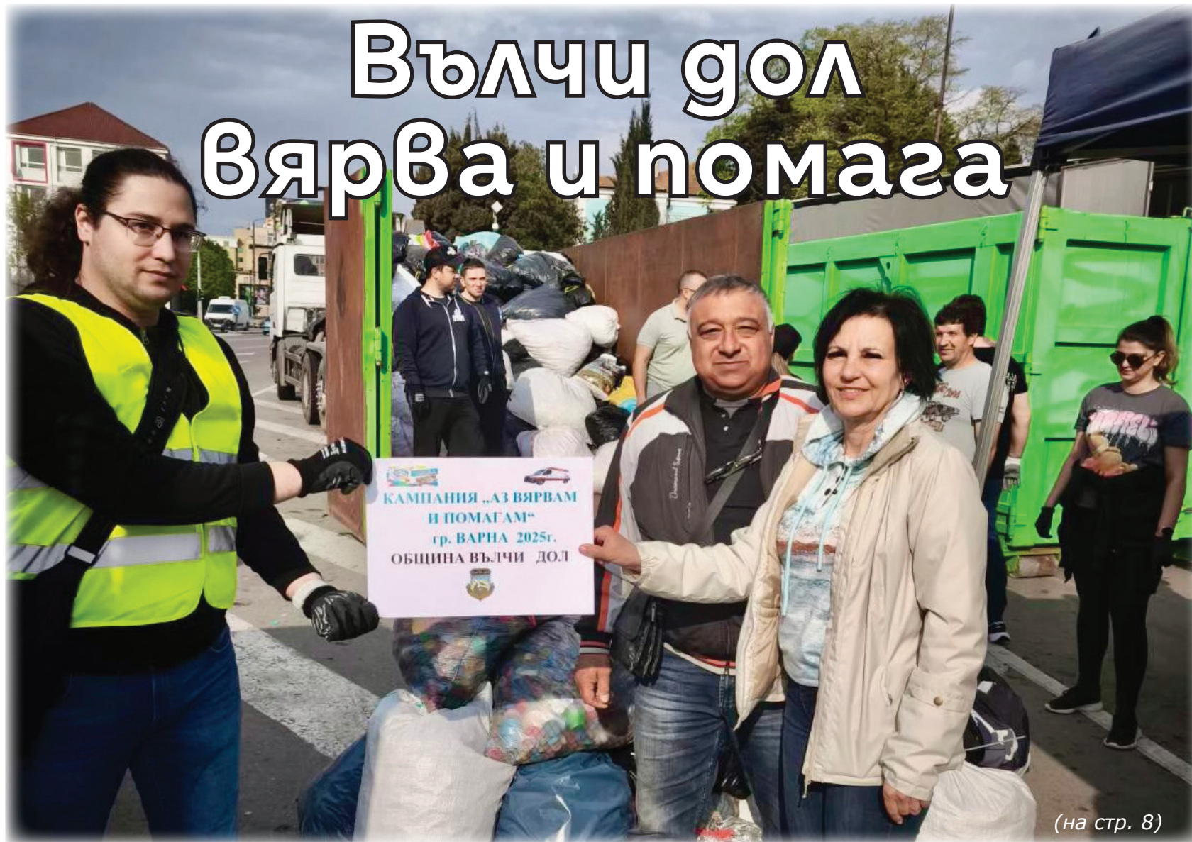
(на стр. 8)

Решения на Общинския съвет - на стр. 2 - 4