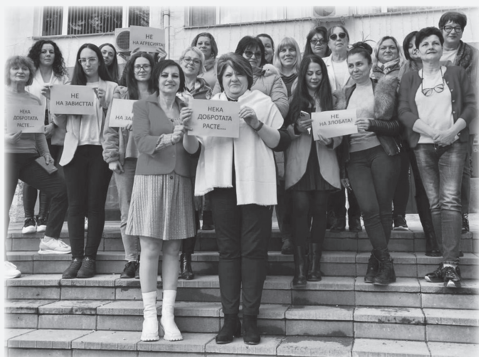
По инициатива на Местната комисия за борба срещу противообществените прояви на малолетните и непълнолетните на 25 февруари – Денят на розовата фланелка, Община Вълчи дол отбеляза Световния ден за борба с тормоза в училище.

II. Дава съгласие за продажба, чрез публичен търг